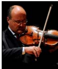
Preis: EUR 25,- .

Das "fantastisch-erzählerische" Programm enthält Schumann, Brahms, Reineke, Hindemith (der ja selbst Bratschist war) und andere.