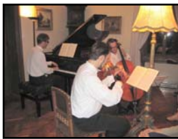
(Trio Nr. 1) und Maurice Ravel.