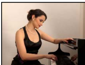
auch Schubert und Liszt.